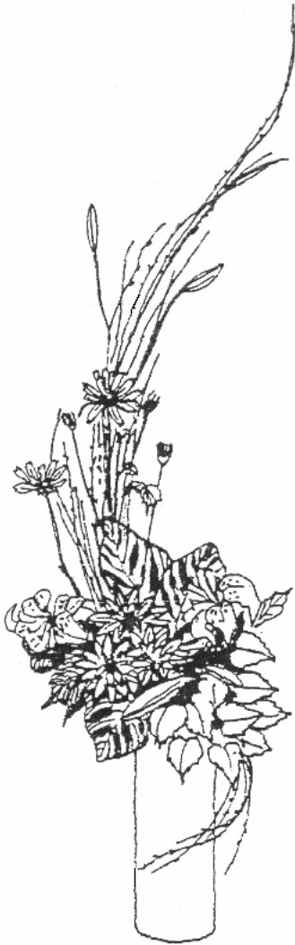
Versione tradizionale con ginestra (1)